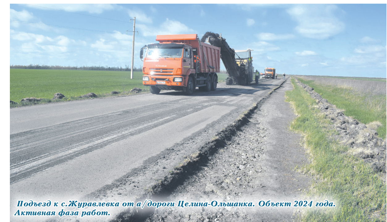
Подъезд к с.Журавлёвка от а/дороги Целина-Ольшанка. Объект 2024 года. Активная фаза работ.

” Вот это, пожалуй, и есть самое главное: люди работают. И слово «дорогие» по отношению к дорогам в контексте всего выше сказанного приобретает ещё один смысл. Дорогие, значит – нужные, необходимые. Такие, за которыми следят и ухаживают. Дарят им подарки в виде асфальтобетонной одежды и по необходимости и возможности – ремонтируют её. Ну, и дай Бог!