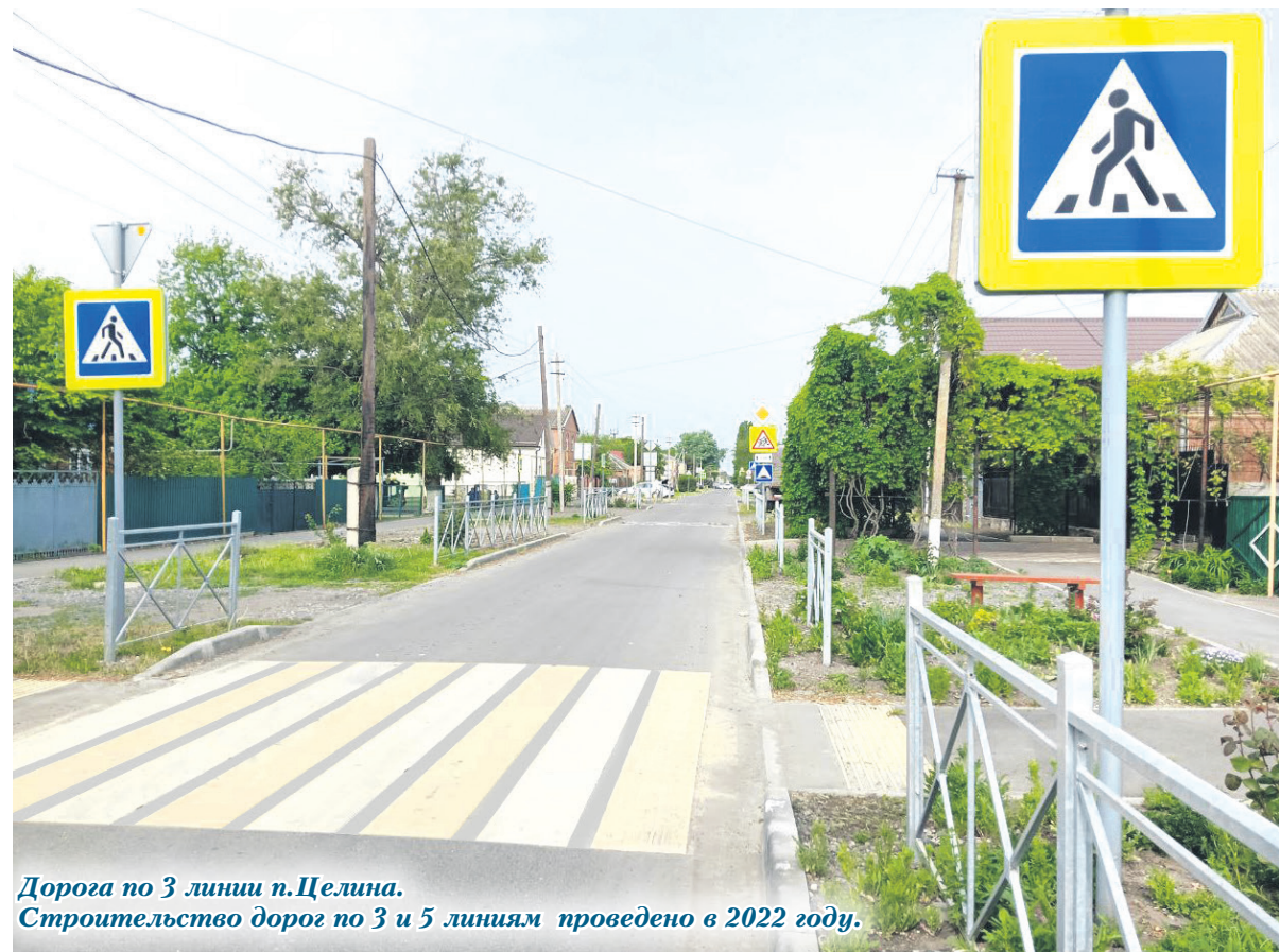
Дорога по 3 линии п.Целина. Строительство дорог по 3 и 5 линиям проведено в 2022 году.

– Здорово! Но ведь, наверное, улица Мира – это далеко не единственный фронт работ для строителей в 2024-ом?