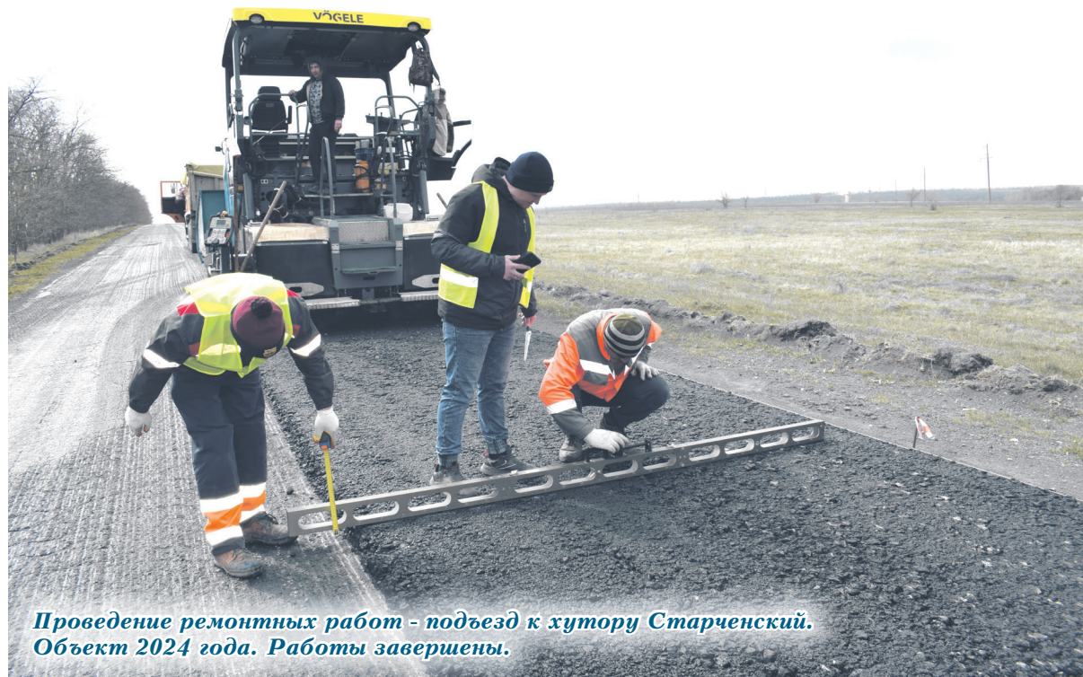
Проведение ремонтных работ - подъезд к хутору Старченский. Объект 2024 года. Работы завершены.