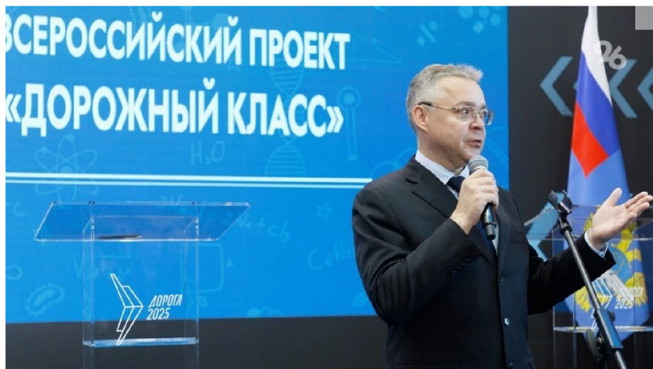
Губернатор Ставропольского края Владимир Владимиров

Выступая перед собравшимися, губернатор Ставропольского края Владимир Владимиров добавил, что дорожная отрасль нуждается в рабочих руках, а ранняя профориентация в школах позволит обеспечить кадрами это направление, продолжит дело, сформированное старшим поколением.