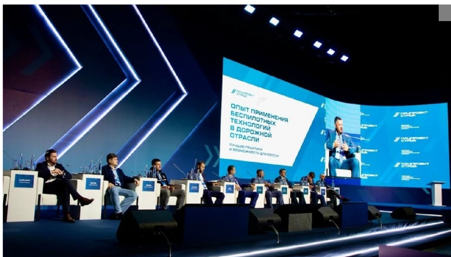
Участники тематической сессии «Опыт применения беспилотных технологий: лучшие практики и возможности для России»