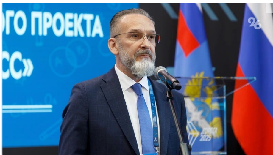
Замминистра Минтранспорта РФ Игорь Костюченко