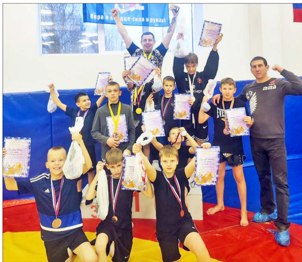
Фото спортивного клуба