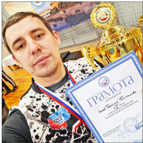
Фото спортивного клуба

По итогам Чемпионата и Первенства области по панкратиону клуб занял 3 командное место.