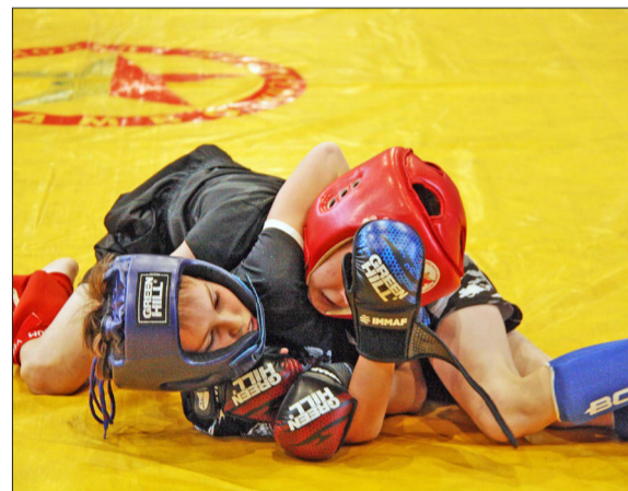
Фото спортивного клуба

– Я горжусь нашими ребятами! За прошлый учебный год мы участвовали более чем в пятнадцати турнирах. Команда завоевала свыше 40 медалей разного достоинства. Взяли третье командное место на первенстве Псковской области по панкратиону, выступали на международных соревнованиях и