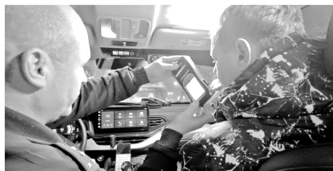
Достаточно выдохнуть, чтобы лишиться прав.

Сотрудники ДПС отмечают: случаи управления автомобилем несовершеннолетними происходят регулярно, особенно в тёплое время года. Чаше всего дети