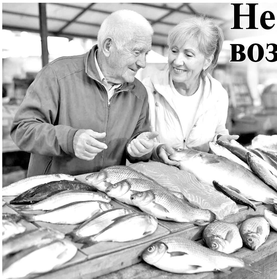
Изображение сгенерировано нейросетью ГигаЧат.

Неделя открытых дверей проводится в областном клиническом диспансере несколько раз в год. Кроме этого возможность сдать базовые анализы есть у каждого человека во время диспансеризации в поликлинике по месту жительства. Специалисты рекомендуют не игнорировать медосмотр. Записаться на приём можно по номеру 1300 или у лечащего врача.