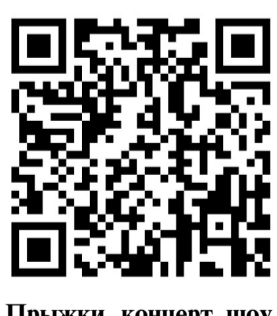
Прыжки, концерт, шоу.

Зрителей ждут выступления творческих коллективов области, лазерное световое шоу, розыгрыши призов и, конечно, фейерверк. Вход свободный.