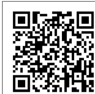
Ночь с ДПС.

Корреспондент «Советского Сахалина» отправля-