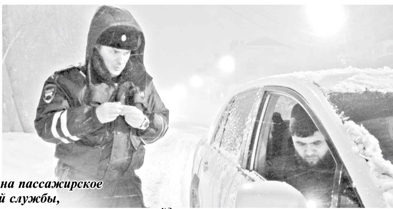
Стандартная проверка документов.

Сменив компьютерное кресло на пассажирское в машине дорожно-патрульной службы, корреспондент «Советского Сахалина» провела ночь в рейде