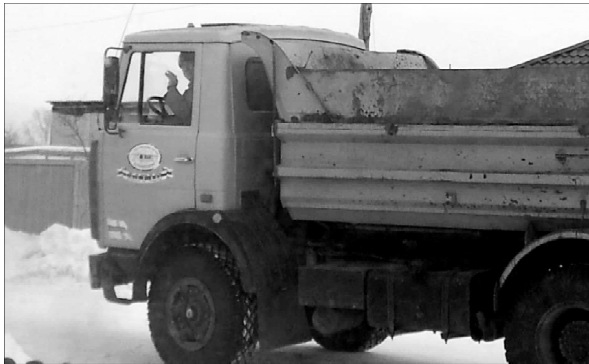
Тот самый МАЗ.

Бывают и командировки, ведь дороги сотрудники Крутихинского участка строят по всему краю. Приходилось в середине осени жить в неотопляемом вагончике и мыться в ледяной воде протекающей рядом речки. Словом, бывало всякое, но ни профессию, ни место работы даже в голову не приходило сменить