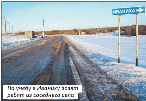
На учебу в Иваниху возят ребят из соседнего села

В 2026 году в Саратовской области продолжится ремонт региональных дорог в рамках нацпроекта «Инфраструктура для жизни», инициированного президентом Владимиром Путиным.