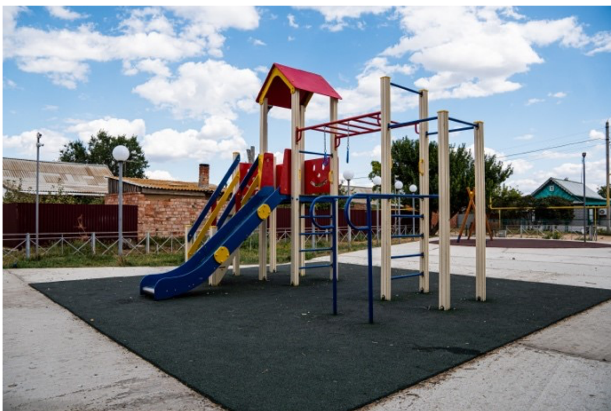
2 место: парк в поселке Комсомольский (Ахтубинский район)