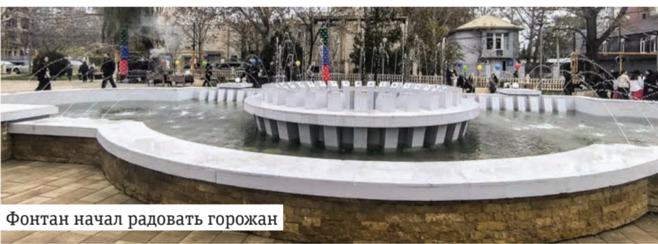
Фонтан начал радовать горожан