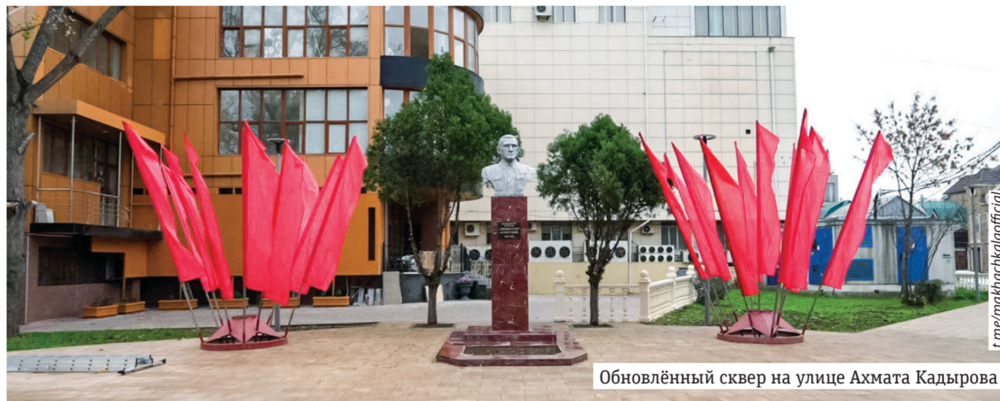
Обновленный сквер на улице Ахмата Кадырова

Фактически жизнь человека – это постоянный поиск баланса между запросами совести и потребления. Этот баланс редко бывает четким и однозначным. В любом случае продолжай верить, что настоящую жизнь всегда строят честность, ответственность и исполнительность. Наше дело – оптимизм. Победа будет за терпением!