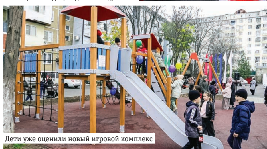
Дети уже оценили новый игровой комплекс