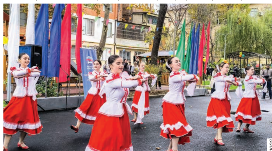
Ансамбль «Молодость Кавказа»

«Благоустройство территорий – это не история про уложенную плитку и новые