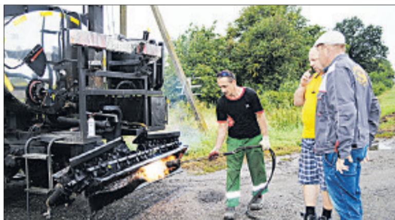
Рабочее утро дорожников начинается с подготовки техники и оборудования.

Работы стартовали в мае и уже дали ощутимые результаты. Было проведено фрезерование полотна и стабилизация основания с использованием ресайклера – дорогостоящей машины стоимостью в миллион долларов, что говорит о серьёзном подходе к качеству. Новый