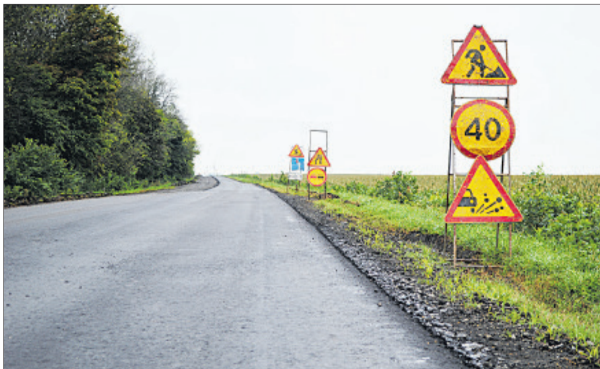
Новый асфальт ждёт разметки, чтобы упорядочить движение на дороге.

С помощью гидравлического аварийно-спасательного оборудования они освободили пострадавшего из повреждённого автомобиля и передали его медикам.