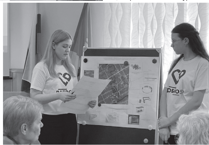
Материалы подготовила Светлана НАШИВАНКО