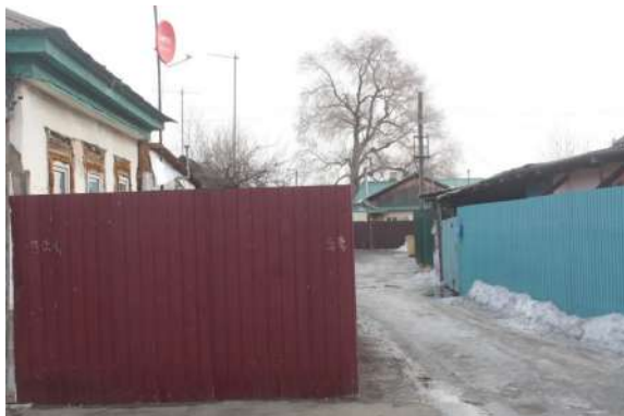
Расселить и снести: старый жилой квартал собираются перестроить в центре Уссурийска.

Решение о комплексном развитии территории планируют принять в мае 2023 года. На расселение жилого квартала округу потребуется 1,5 млрд рублей. При этом перспективная застройка, по предварительным расчетам, принесет 9,7 млрд рублей валовой прибыли.