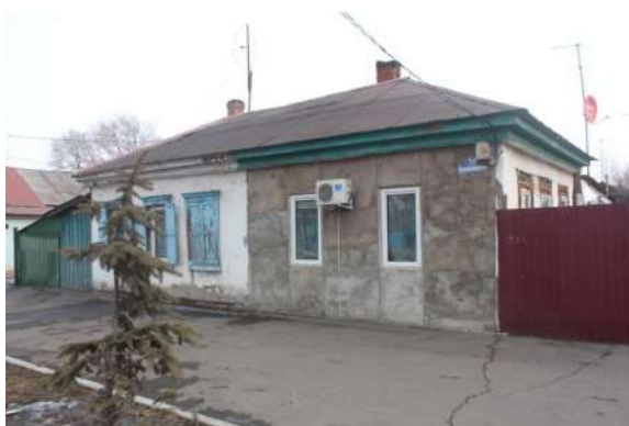
Расселить и снести: старый жилой квартал собираются перестроить в центре Уссурийска.

В комплексное развитие могут попасть объекты индивидуального жилищного строительства и жилые дома блокированной застройки. Для этого они должны соответствовать хотя бы одному из следующих требований: физический износ конструктивных элементов более чем на 60%; отсутствует хотя бы одна или несколько централизованных систем инженерно-технического обеспечения (теплоснабжение, водоснабжение, водоотведение).