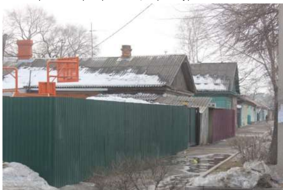
Расселить и снести: старый жилой квартал собираются перестроить в центре Уссурийска.