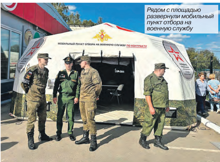
Рядом с площадью развернули мобильный пункт отбора на военную службу