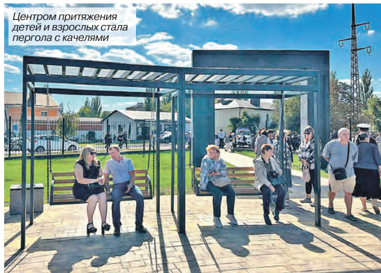
Центром притяжения детей и взрослых стала пергола с качелями