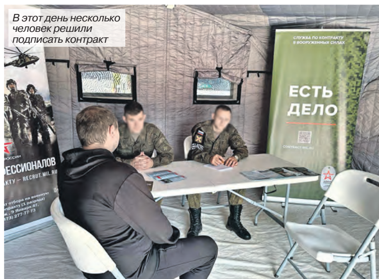
В этот день несколько человек решили подписать контракт