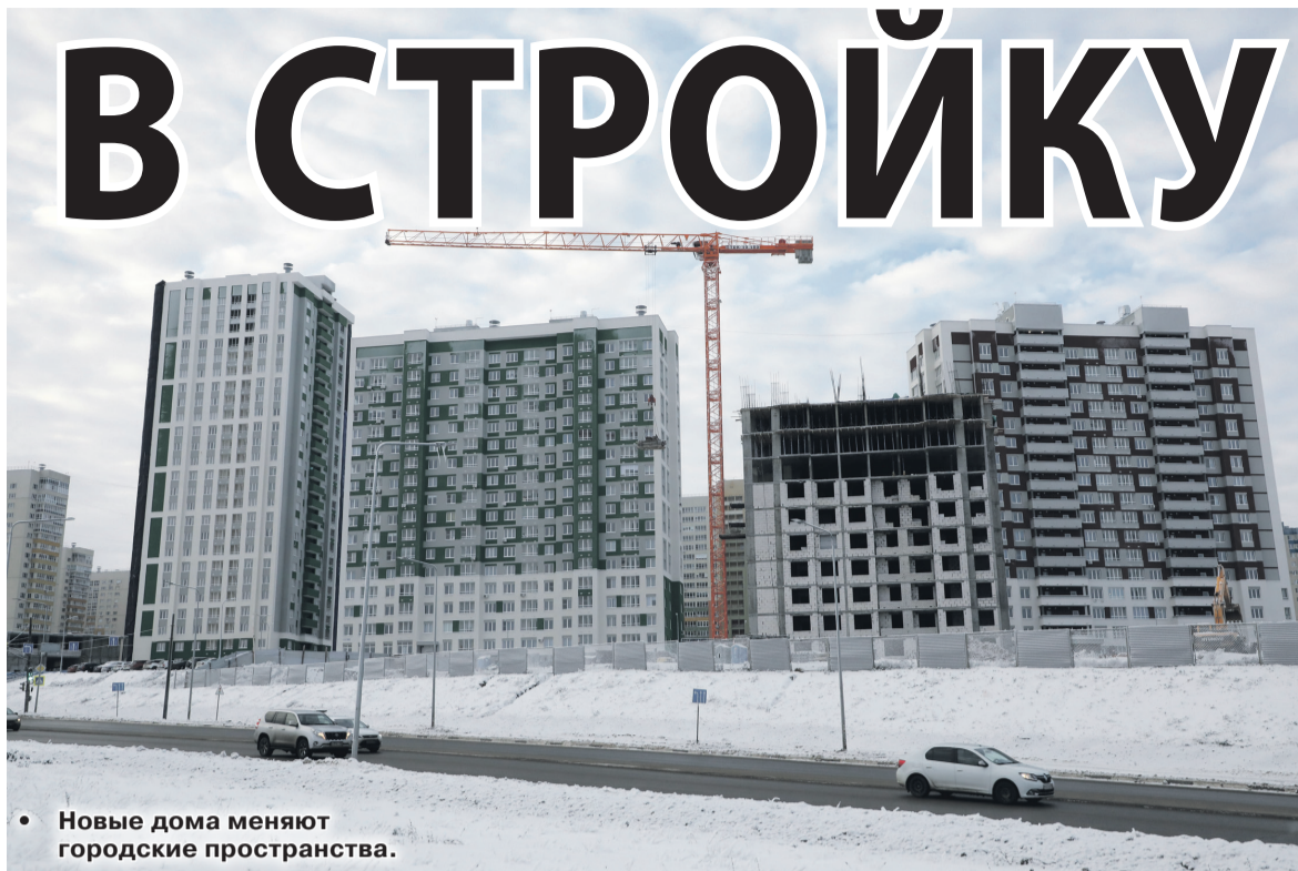
• Новые дома меняют городские пространства.

Развёрнут новое строительство и в Ленинском районе в границах улиц Правды, Чонгарской и Менделеева. На территории площадью 1,8 гектара на данный момент стоят девять многоквартирных домов, пять из которых — аварийные, преимущественно деревянные двухэтажные, барачного типа. Согласно мастер-плану совсем скоро на их месте появятся современные дома переменной