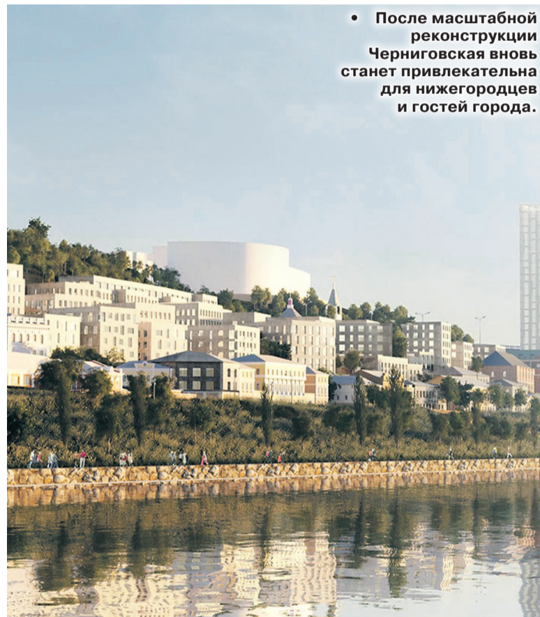
• После масштабной реконструкции Черниговская вновь станет привлекательной для нижегородцев и гостей города.

Помимо комплексного развития территорий продолжается работа и в тех микрорайонах, которые были заложены ранее. Так, недавно был достроен 17-й дом печально знаменитого жилого комплекса «Новинки Smart Сити». Достройкой комплекса, брошенной компанией-банкротом, с 2019 года занимается Фонд защиты дольщиков. Всего по проекту тут должны построить 25 домов. В следующем учебном году здесь планируется запустить новую школу.