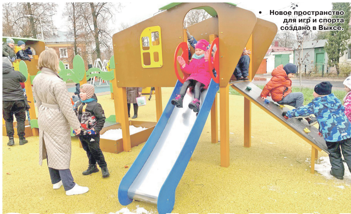
• Новое пространство для игр и спорта создано в Выксе.