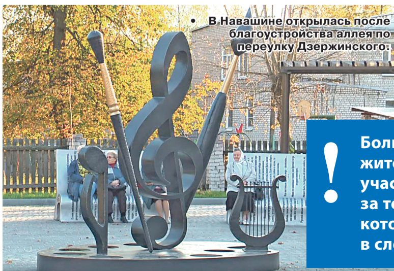
• В Навашине открылась после благоустройства аллея по переулку Дзержинского.

90 общественных пространств благоустроили в Нижегородской области в 2023 году