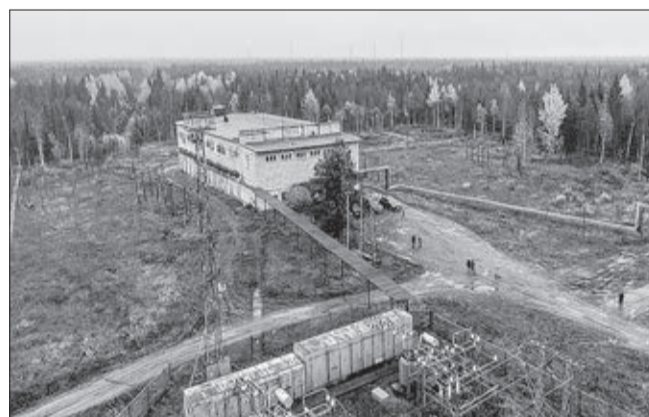
ПРАВОМ ОСВОЕНИЯ СЕВЕРОДВИНСКОГО МЕСТОРОЖДЕНИЯ ЙОДНЫХ ВОД ОБЛАДАЕТ РЕЗИДЕНТ АЗРФ – КОМПАНИЯ «РУССКИЙ ЙОД»

Напомним, что Арктическая зона РФ (АЗРФ) – крупнейшая особая экономическая зона в мире, на которой инвесторы пользуются специальными режимами налогового и административного регулирования.