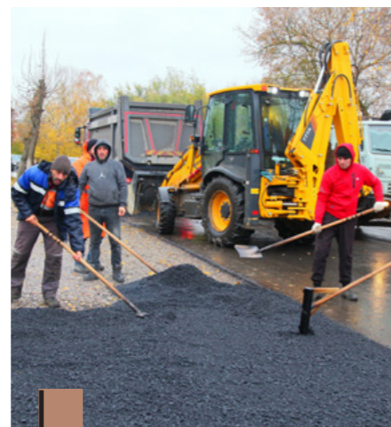
Новые дороги готовы