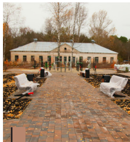
Последние приготовления в сквере «Семья»

Работы на этом объекте будут завершены до конца года, хозяева смогут заехать в новые квартиры уже в январе 2025-го. Стоимость строительства – свыше 59 миллионов рублей.