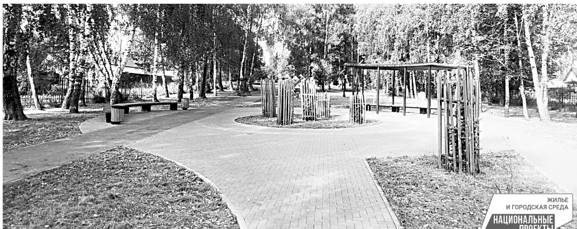
■ В Золотаревке преобразилась площадь перед местным досуговым центром

ТОЧКИ РОСТА ■ Один из показателей успешного развития региона – удобство и эстетичность жизненного пространства, в котором живут люди. И если раньше по уровню комфорта областной центр сильно опережал глубинку, то сейчас этот разрыв становится все меньше