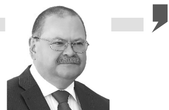
Губернатор Пензенской области Олег МЕЛЬНИЧЕНКО:

– Создавать комфортную среду для людей необходимо. Особенно в малых городах, где сегодня живут сотни тысяч человек. Это очень важная составляющая нашей жизни, поскольку в этих населенных пунктах в значительной степени сосредоточена наша история, культура. Комплексное развитие территорий, повышение качества жизни жителей, независимо от численности и удаленности от областного центра, должно стать нашим приоритетом.