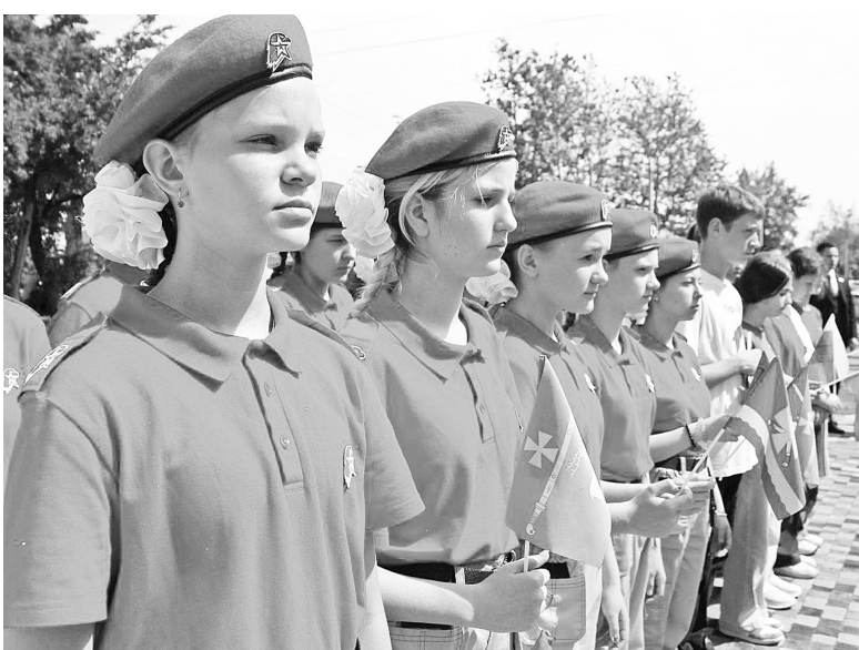
► В одном строю с фронтовиками.