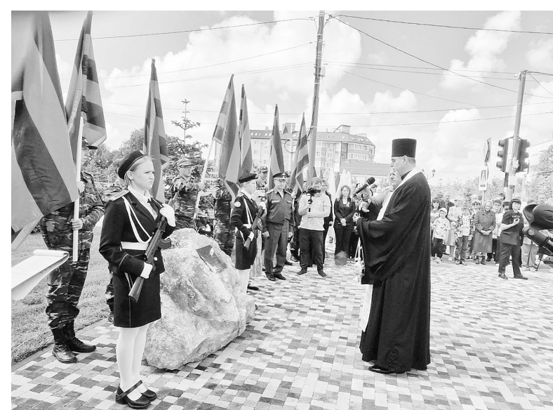
► Освящение памятного камня.