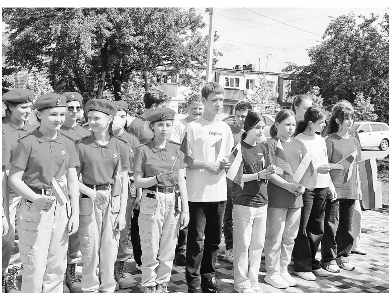
► Будущее за вами, юные динчане!