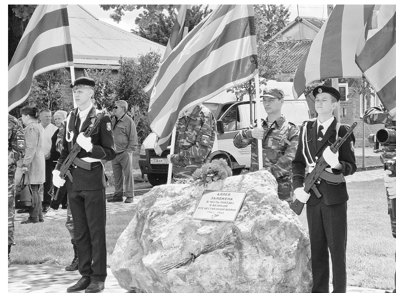
► Застыл почетный караул.