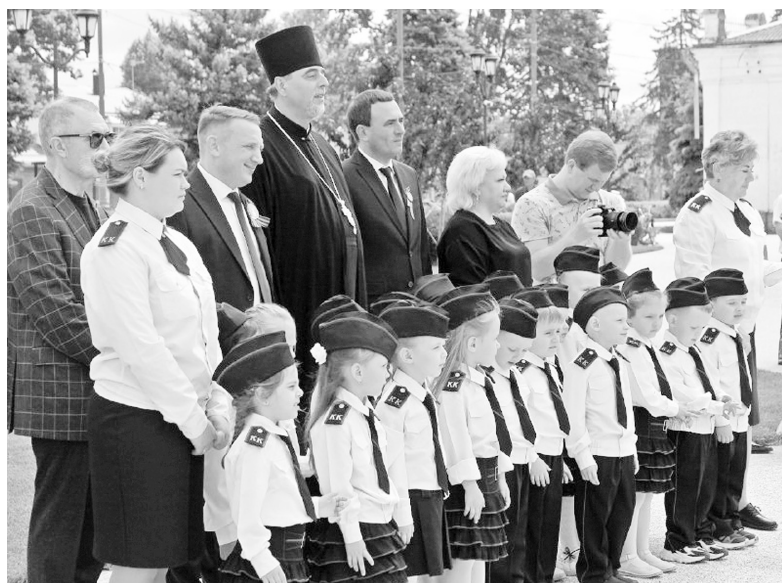
► Поддержать казачат пришли руководители района.