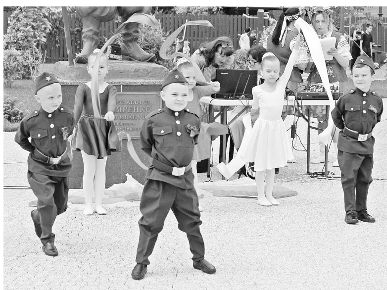
► Юные артисты радовали динчан.