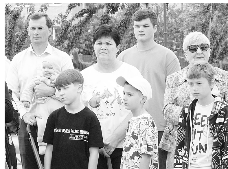
► Мы – русский мир, и все мы вместе!