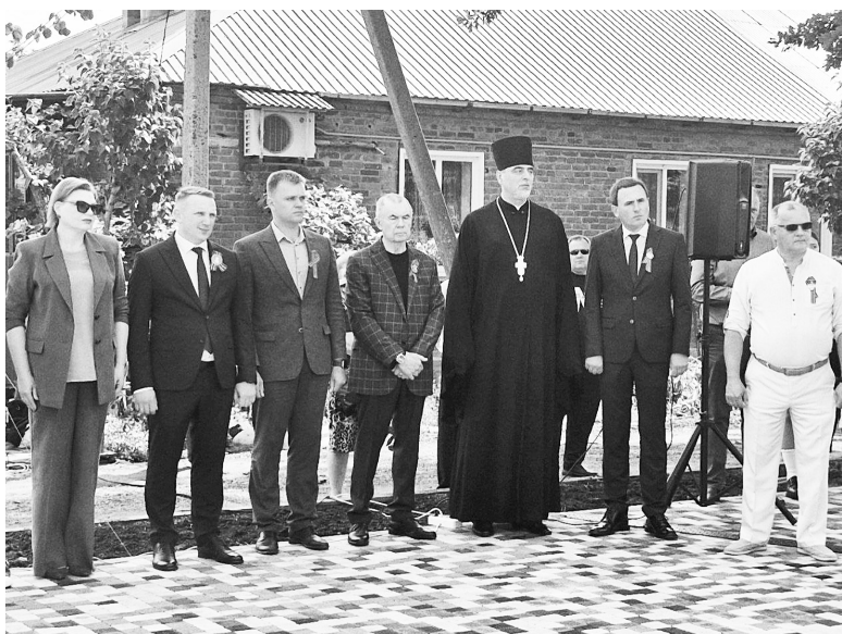
► Первое мгновение торжественного открытия.