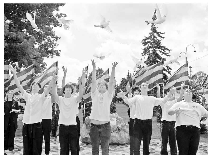
► Летите, голуби, летите!