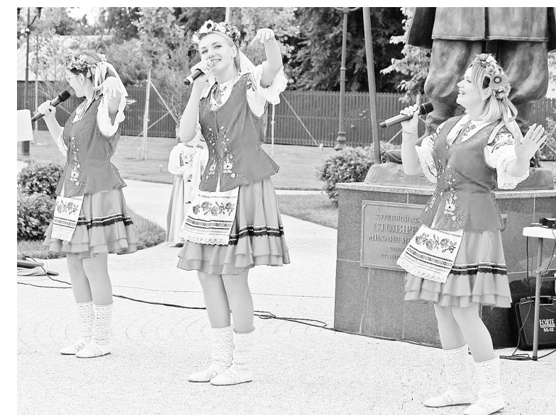
► Песни создавали солнечное настроение.