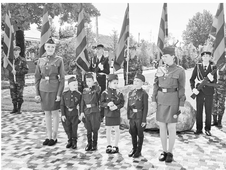
► Подвиги предков в памяти потомков.