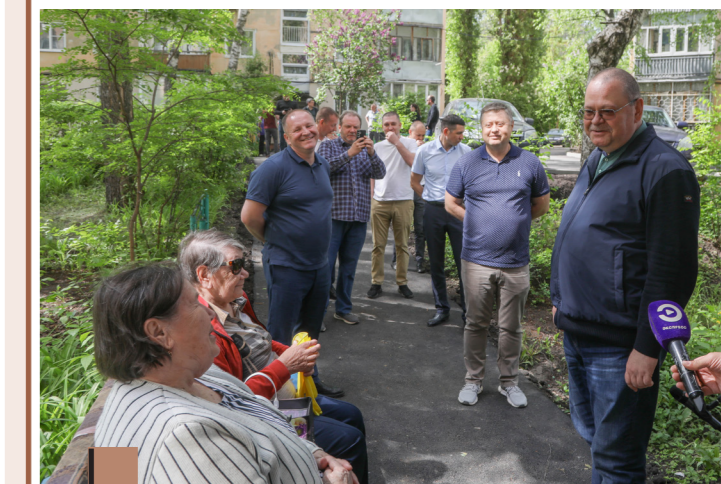
Глава региона лично контролирует реализацию программы «Мой двор»

Это очень важный для пензенцев проект. Буду находить время выезжать на объекты. Главная оценка работы для меня – мнение граждан, с которыми я общаюсь во время выездов.