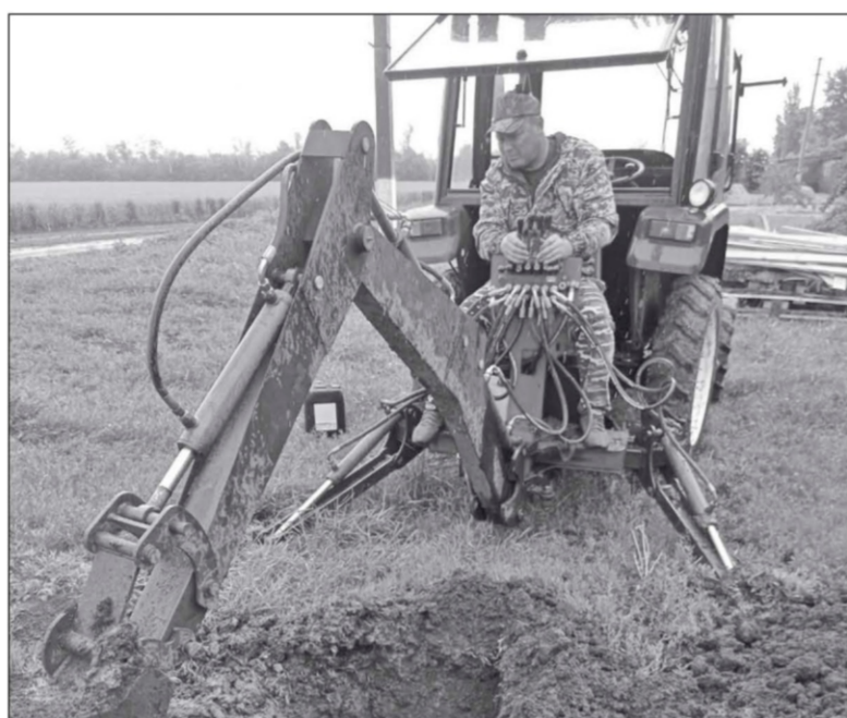
ЖКХ «Березанское» проводит постоянные работы по устранению утечек водопровода, потери воды уменьшились по сравнению с 2024 годом на 10%.

Развитие территории. В Березанской в Заречном построили сквер, а учреждения