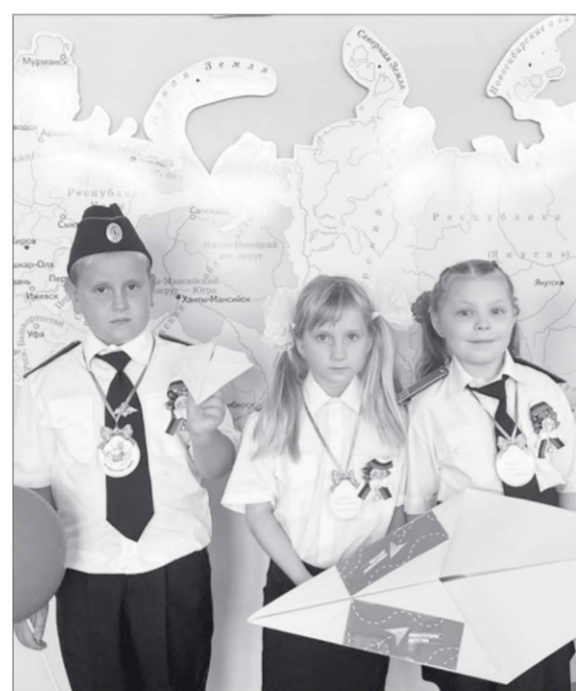
В СОШ №3 ст. Березанской сделали капитальный ремонт по программе «Молодёжь и дети».

пробурили новую скважину, капитально отремонтировали школу, культуры посёлка вступили в программу «Пушкинская карта»