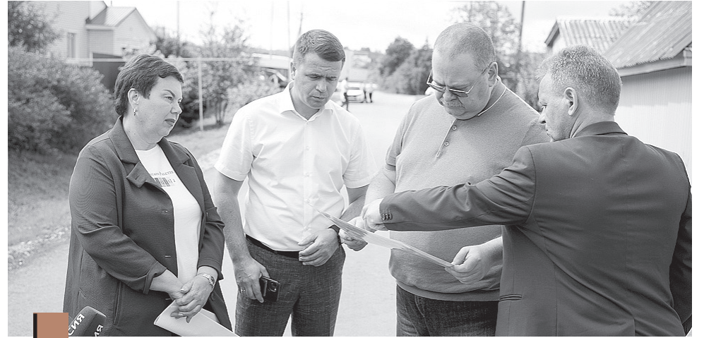
Губернатор отмечает высокие темпы работ по благоустройству в муниципальных образованиях региона

Большой объем работ предстоит выполнить в этом году и в Сердобске. Там ведется реконструкция территории у районного ДК (площадь, которую предстоит облагородить, составляет более 2,5 тыс. кв. м).