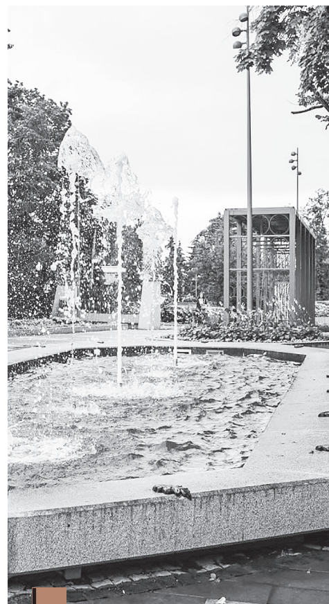
Продолжается благоустройство парка им. В.Г. Белинского