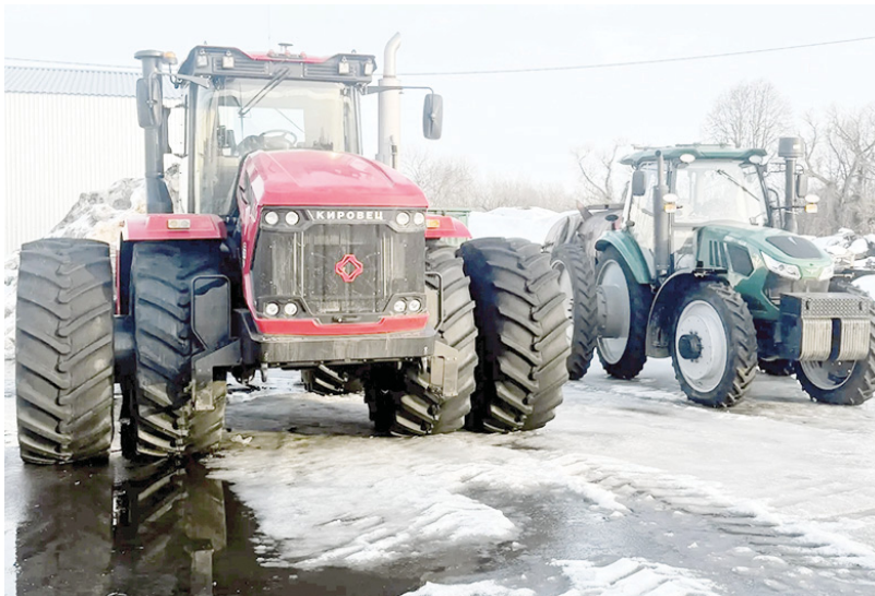
Для успешного проведения весенних работ техника готова

В достаточном количестве здесь завезли и такие удобрения, как диаммофоска и сульфат аммония. Полностью обеспечены и семенами, и удобрениями, и средствами защиты. Для успешного проведения всего комплекса весенне-полевых работ в хозяйстве были своевременно подготовлены необходимая сельскохозяйственная техника и при-