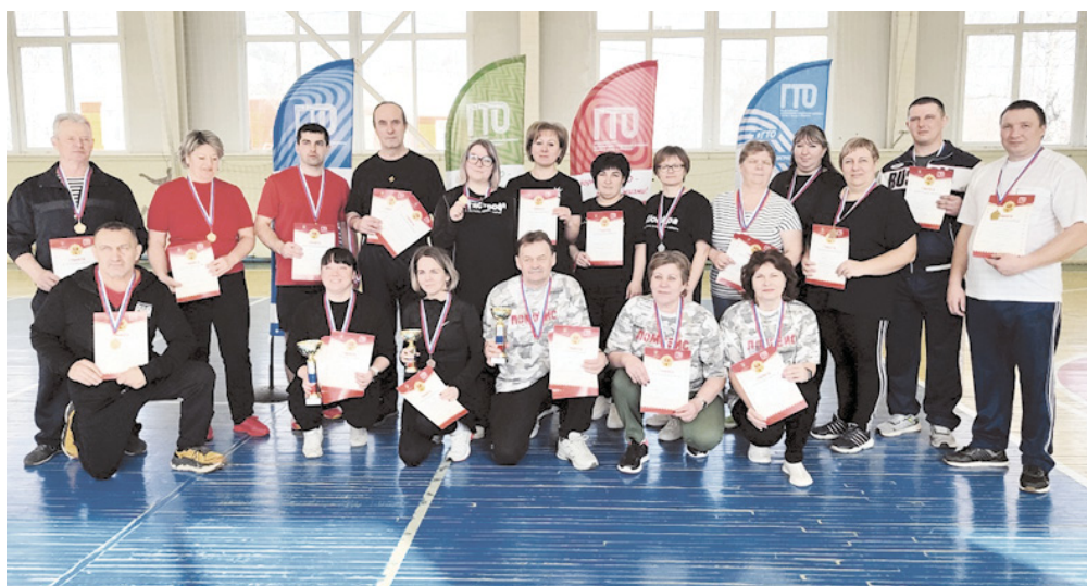
Победители и призёры муниципального этапа ГТО