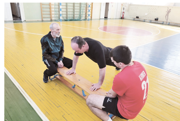
Отжимались от скамьи мужчины старшего возраста