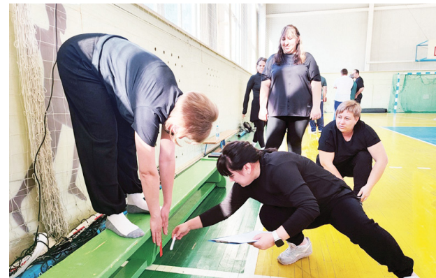
Упражнения на гибкость

Победителям и призёрам соревнований организаторы вручили грамоты и медали соответствующих достоинств, а лучшие команды забрали с собой ещё и кубки. ■