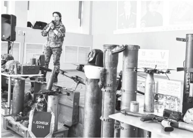
Люсьена Дейсар пообщалась со школьниками