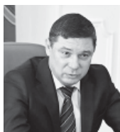
Евгений ПЕРВЫШОВ, глава Тамбовской области

В настоящее время в регионе создано три промышленных кластера: сельскохозяйственного машиностроения, мебельный и нефтегазовый. Пять производств, занимающихся созданием почвообрабатывающей техники, объединились в кластер сельскохозяйственного машиностроения на базе «Агротеха», благодаря чему удалось ускорить производство продукции и увеличить её объёмы. ■