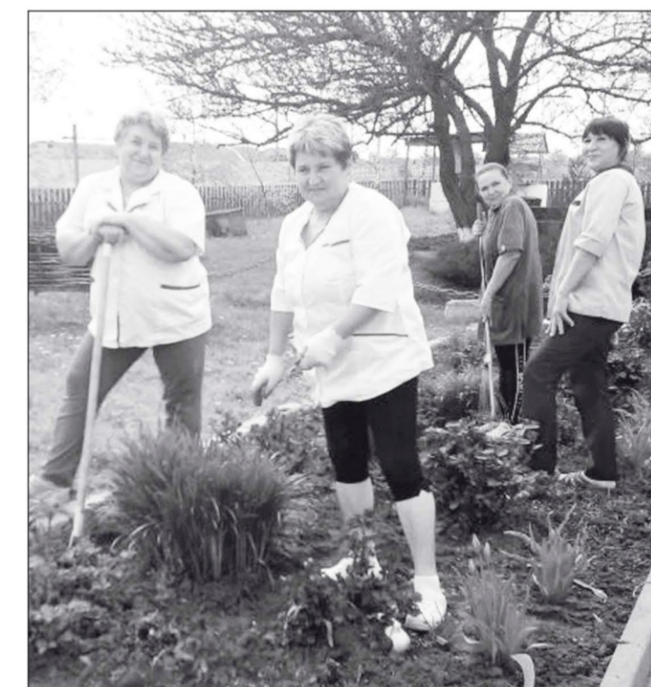
Труженицы предпр. «Газырское» фирмы «Агрокомплекс»