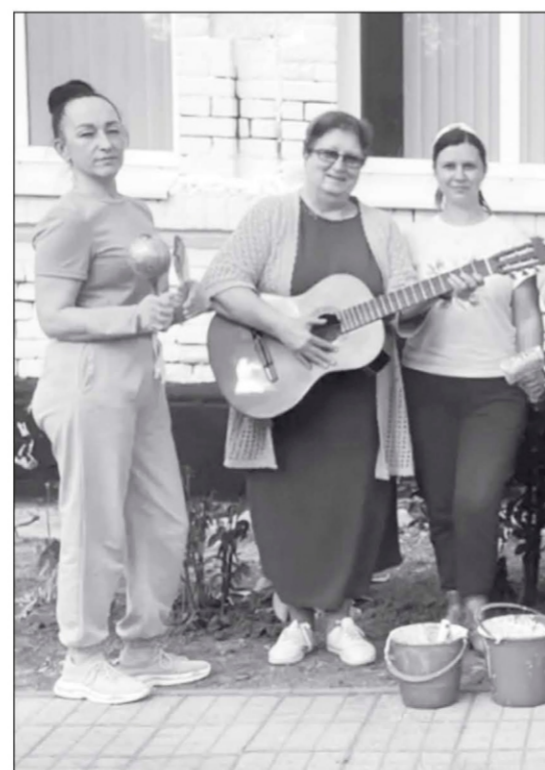
Музыкальный субботник организовал