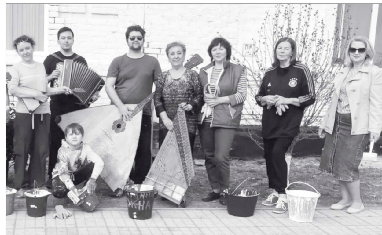
дружный коллектив Березанской детской школы искусств. Такого мы ещё не видели!

От редакции. От всей души благодарим все коллективы, которые находят время и силы участвовать в субботниках — благоустраивать свои территории и делать наш общий дом ещё красивее и комфортнее. Благодаря вам улицы, парки, скверы и дворы становятся всё чище и уютнее, а атмосфера в населённых пунктах — теплее и дружелюбнее. Уважаемые земляки, давайте продолжать в том же духе — вместе мы можем многое!