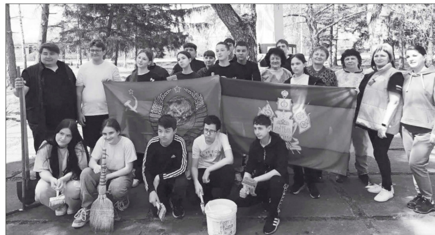
Коллектив бузиновской школы №15 высадил клёны, берёзы и цветы. Станичники поддержали акцию «Сад памяти».

В Газырском поселении большая работа проведена на кладбище посёлка Газырь. Уборку выполнили сотрудни-