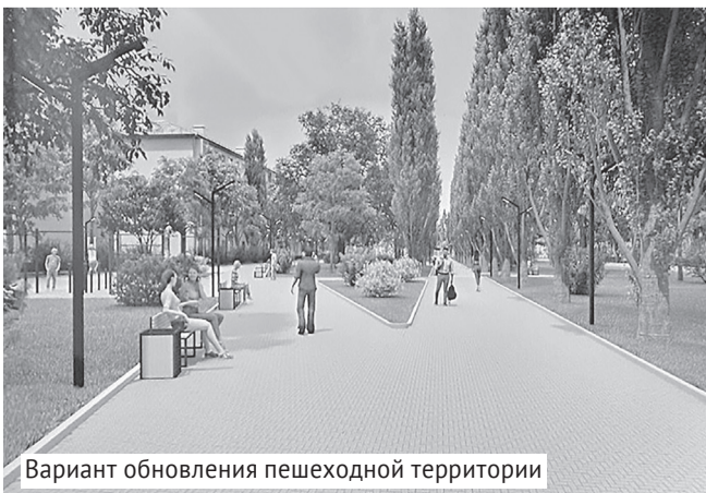
Вариант обновления пешеходной территории