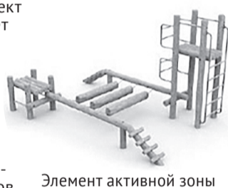
Элемент активной зоны