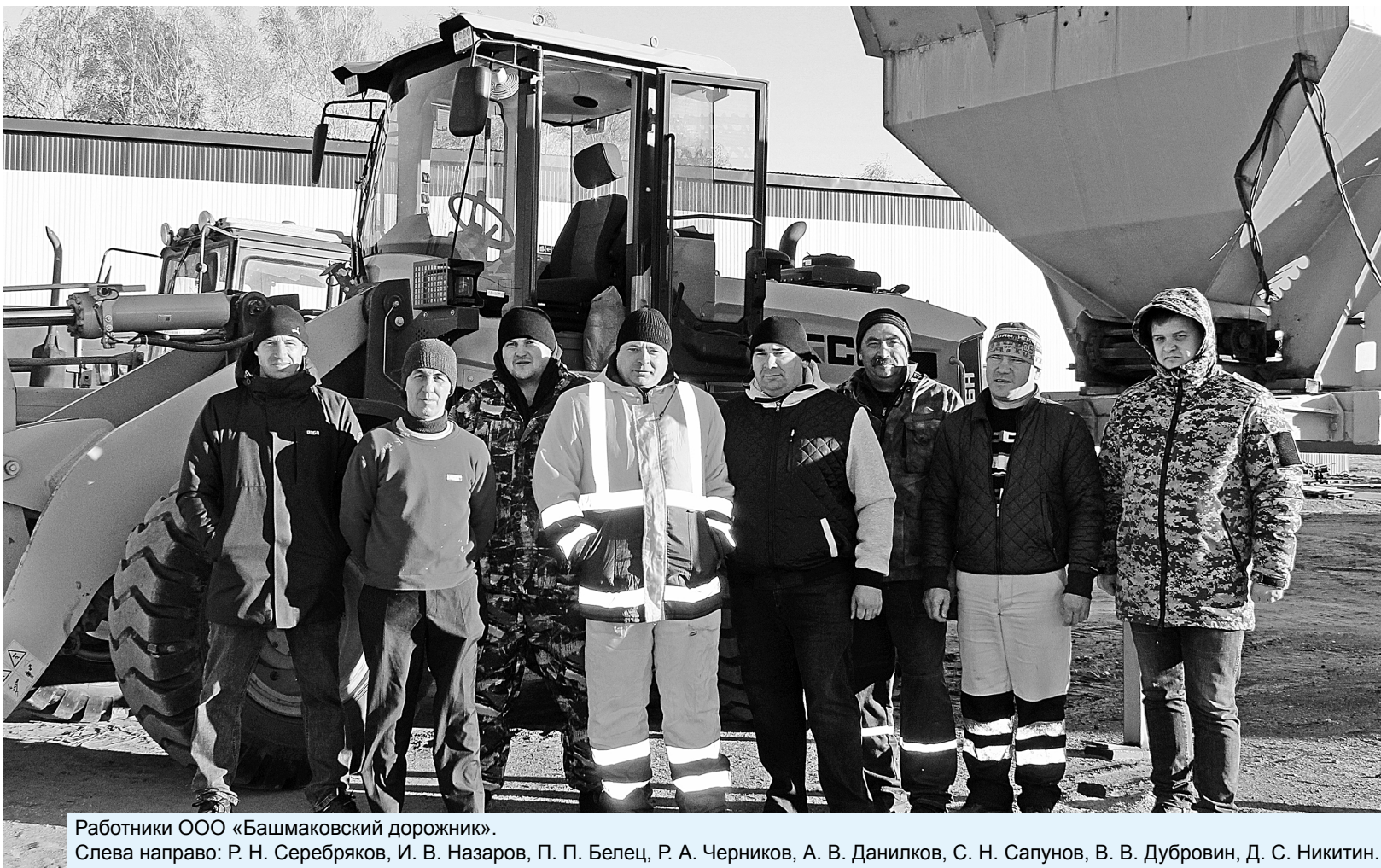
Работники ООО «Башмаковский дорожник».